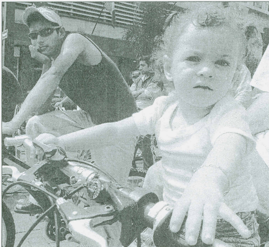
EL INFORMADOR • R. PÉREZ

Los domingos, los tapatíos han encontrado una nueva forma de convivencia: acudir a pasear por las calles de la ciudad, sin tenerse que preocupar por el tráfico y la contaminación